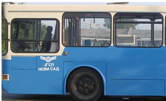
Сл. 3 Оквирни приказ захтеваног лакирања

Завршно лакирање извршиће се у договору са наручиоцем, према скици фарбања која ће бити достављена понуђачу коме се додели уговор. Завршно лакирање доњег дела оплате потребно је извршити са лаком РАЛ-5015, а горњег дела са лаком РАЛ-1015 (граница горњег и доњег дела оплате је доња ивица бочних стакала, слика 3).