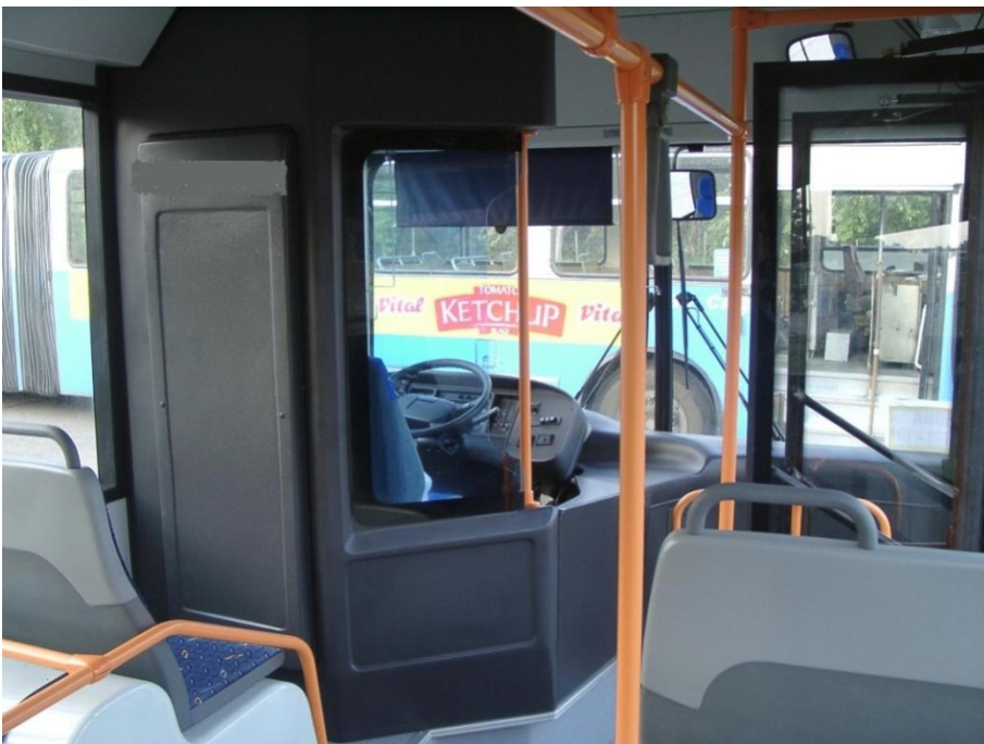
Сл. 1 Пример захтеване возачке кабине

Брава за отварање/затварање врата и забрављивање у затвореном положају треба да се налази са унутрашње стране врата - до возача.